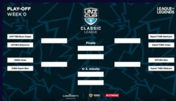
Play-off pavúk Classic ligy v LoL.

Hru League of Legends ovládli tímy TUKE, z ktorých sa predstavi v play-off hneď trojica. Nebudú však chýbať ani reprezentanti STU, UCM a UNIZA.