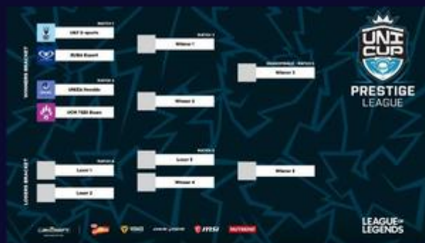
Play-off pavúk Prestige ligy v LoL.

V League of Legends prvé miesto obsadil nitriansky UKF E-sports, ktorý z druhého a tretieho miesta doplnia UNIZA Herolds a UCM TEDI Bears Sigma. Najvyrovnanejší bodový súboj o posledné postupové miesto si odniesol EUBA Esport, ktorému pomohol vzájomný zápas.