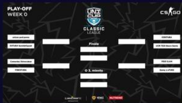
Kto vyhrá celú CS:GO Classic league?

Najväčšie zastúpenie v CS:GO osmičke má naopak Slovenská technická univerzita v Bratislave. Tú doplnia už stálice UniCupu, ktoré v tesných postupových súbojoch pripravili nielen nováčikov z PEVŠ o play-off.