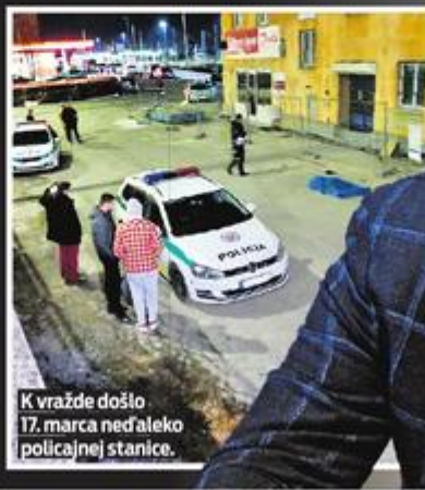
K vražde došlo 17. marca neďaleko policajnej stanice.