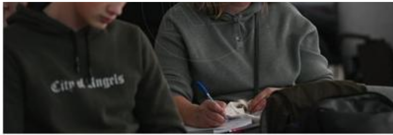
Záujem o štúdium na jednotlivých vysokých školách rastie aj v metropole východu (ilustračná fotografia)

Univerzita veterinárskeho lekárstva a farmácie (UVLF) v Košiciach má takmer identický počet podaných prihlášok ako vlani, čo nám potvrdila jej hovorkyňa Zuzana Bobriková: