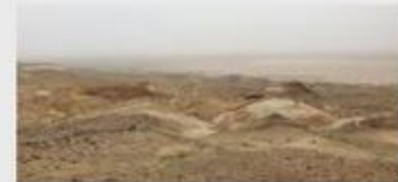
Návšteva slovenskej a uzbeckej paleontologickej expedície a podpis protokolu o spolupráci UJPŠ v Košiciach a Medzinárodného inštitútu stredoázijských štúdií.