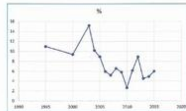
Graf 2. Miera využívania podzemnej vody v SR v rokoch 1995 – 2016 (l/s).