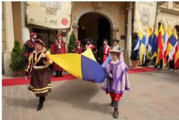
Slávnostný ceremoniál pred udeľovaním ocenení.