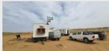
Návšteva slovenskej a uzbeckej paleontologickej expedície a podpis protokolu o spolupráci UJPŠ v Košiciach a Medzinárodného inštitútu stredoázijských štúdií.