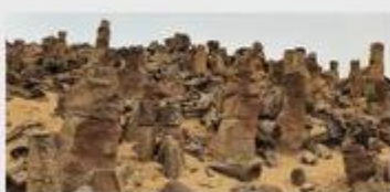
Návšteva slovenskej a uzbeckej paleontologickej expedície a podpis protokolu o spolupráci UJPŠ v Košiciach a Medzinárodného inštitútu stredoázijských štúdií.