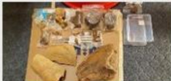
Návšteva slovenskej a uzbeckej paleontologickej expedície a podpis protokolu o spolupráci UJPŠ v Košiciach a Medzinárodného inštitútu stredoázijských štúdií.

V súlade s výskumným projektom IICAS sa pripravuje prieskum podobných prehistorických objektov na území Autonómnej republiky Karakalpakstan. Táto oblasť je jedným z posledných bielych miest na paleontologickej mape sveta.