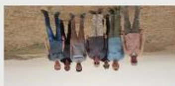
Návšteva slovenskej a uzbeckej paleontologickej expedície a podpis protokolu o spolupráci UJPŠ v Košiciach a Medzinárodného inštitútu stredoázijských štúdií.