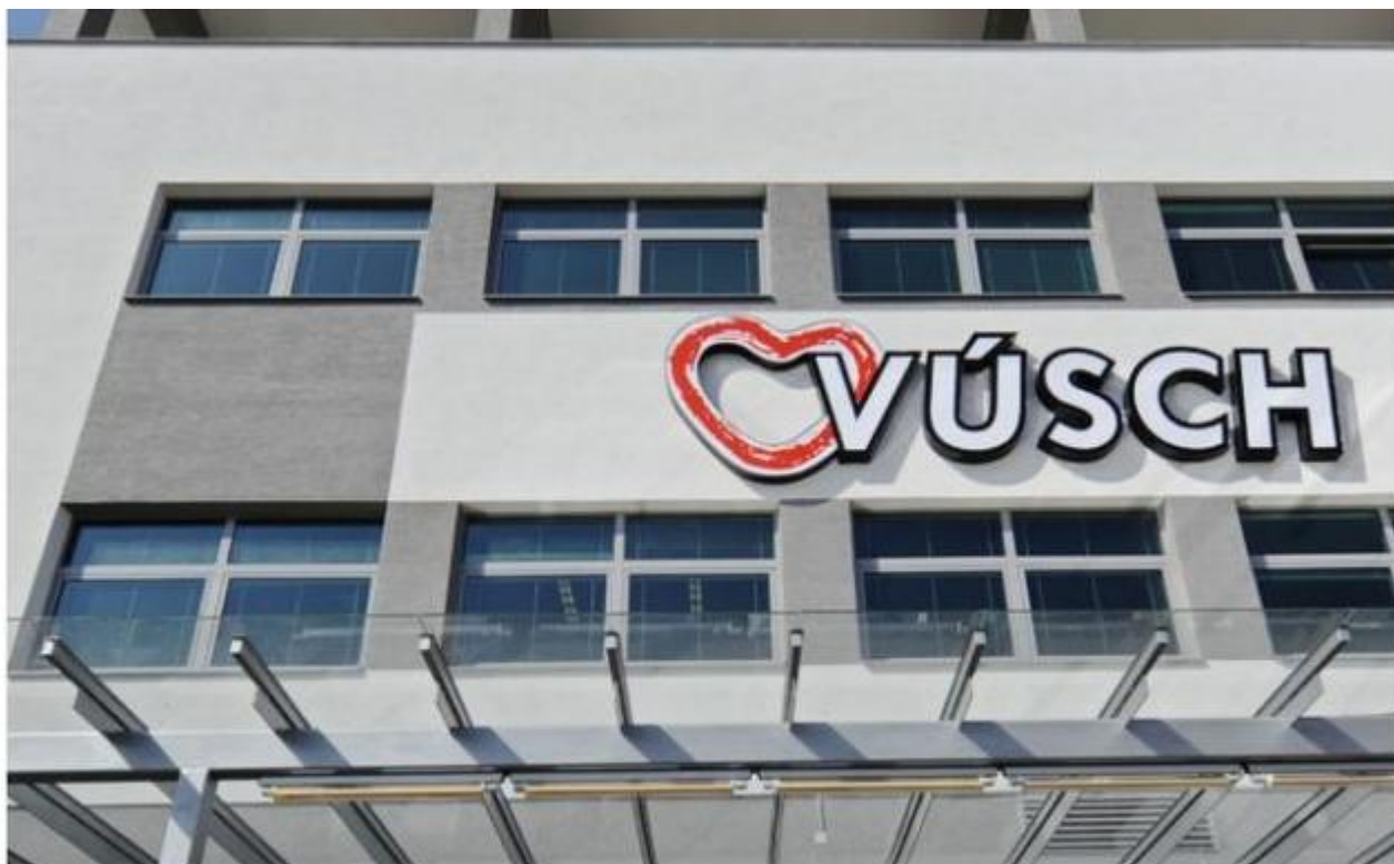
Východoslovenský ústav srdcových a cievnych chorôb.