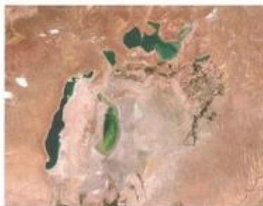
Aralské jazero postupne vysychá. Ilustračné foto.

Slovensko, v porovnaní so štátmi západnej Európy, má pomerne nízku spotrebu vody. V roku 2010 to bolo 83,4 litra na obyvateľa. U nás sa zatiaľ nestretávame s nedostatkom vody. Nebezpečenstvo predstavujú najmä havárie vodárenského systému, ktoré sa prejavujú nedostatkom pitnej vody. Problémy s vodou vnímajú oveľa citlivejšie ľudia na vidieku, ktorí ešte stále používajú studne. Stačí sucho, alebo naopak povodňe, v dôsledku čoho sa prejaví negatívny vplyv na podzemnú vodu. Slovenská republika oplýva bohatými vodnými zdrojmi. Napriek svojej malej rozlohe je u nás registrovaných až 1644 prameňov minerálnych vôd a Žitný ostrov sa považuje za najväčšiu zásobáreň pitnej vody v Strednej Európe.