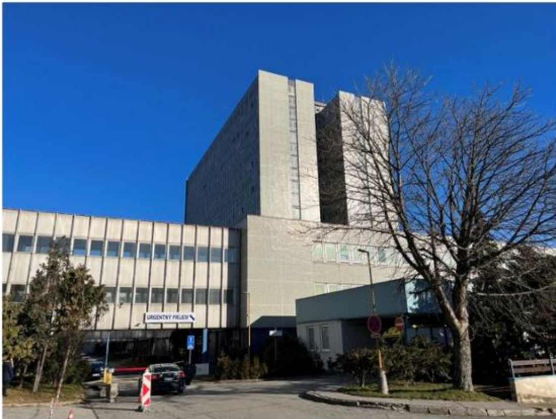
Urgentný príjem v areáli Tr. SNP

Práve pre dosiahnutie optimálnej úrovne komplexnosti a kvality zdravotnej starostlivosti o akútne stavy odporúča vedenie UNLP vybudovanie komplexného urgentného príjmu v areáli Tr. SNP, s priamou väzbou na všetky potrebné odbornosti a s priamym prepojením na Detskú fakultnú nemocnicu Košice (DFN) a Východoslovenský ústav srdcových a cievnych chorôb, a.s. (VUSCH).