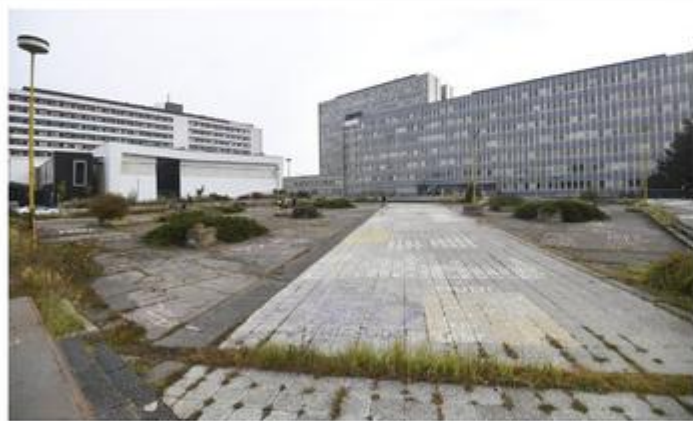
Na Triade SNP by mal vzniknúť komplexný urgentný príjem

„Základným cieľom našej koncepcie je koncentrácia lôžkovej zdravotnej starostlivosti a jej logické usporiadanie. V areáli na Triade SNP by sa mala sústrediť akútna starostlivosť vrátane nadväzujúcich odborností a v areáli Rastislavova najmä následná a dlhodobá zdravotná starostlivosť.“