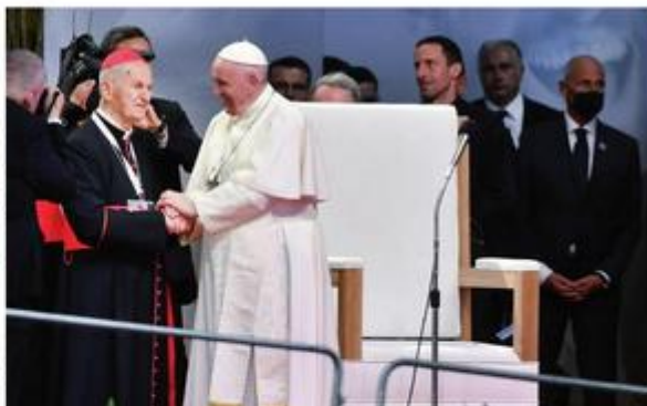
Kardinál Jozef Tomko a Svätý Otec František sa zdravia počas stretnutia s mladými na Štadióne Lokomotíva v Košiciach 14. septembra 2021.