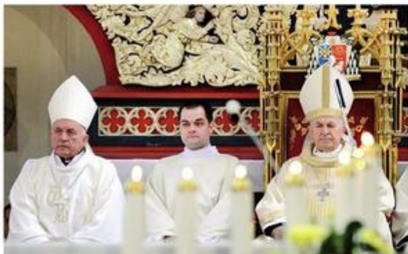
Rok 2014. Svätá omša pri príležitosti životného jubilea kardinála Jozefa Tomka (vpravo) a arcibiskupa Mons. Alojza Tkáča (vľavo) v Dóme sv. Alžbety v Košiciach.