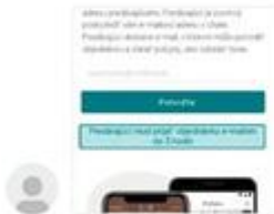
Obrázok 1 Ukážka konverzácie z aplikácie Vinted

Následne na danú emailovú adresu útočník zašle emailovú správu, ktorej ukážku vidieť nižšie: