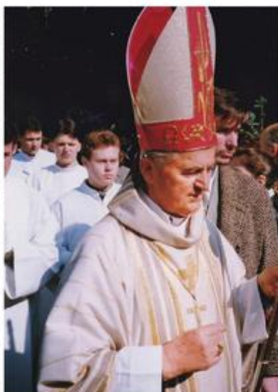
Kardinál Tomko v Košiciach.

Uctiť si pamiatku emeritného prefekta Kongregácie pre evanjelizáciu národov kardinála Tomka môže v Košiciach i verejný.