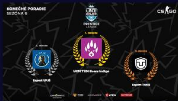
Konečné poradie šiestej sezóny UniCup Prestige League v CS:GO.

Svojmu súperovi nedali šancu a po výsledku 2:0 na mapy sa stali víťazmi tohto ročníku UniCup Prestige League.