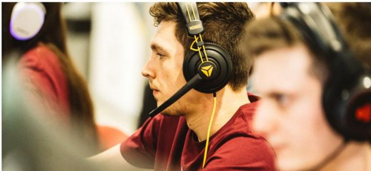
UniCup pozná tohtoročných víťazov (Zdroj: Tlačová správa/L'anoa!)

#Univerzitná liga UniCup má za sebou poriadne napínavé finále. Tímy bojovali skutočne vyrovnané a my sme sa získali mená tohtoročných víťazov obľúbenej e-sportovej ligy. Aby ti nič neušlo, všetko sme pre teba spísali.