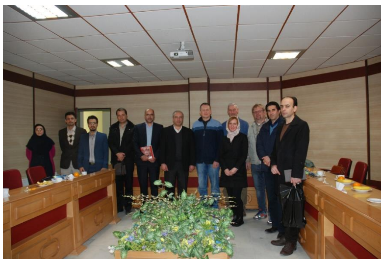
Oficiálne rokovanie so zástupcami univerzity Zanja

Záver dňa vyplňa pozvanie druhej univerzity v Zanjane. Dnes sme mali možnosť poznať výnimočných ľudí. Ďakujeme všetkým za priateľské prijatie, pohostinnosť a záujem o spoluprácu na našom expedičnom projekte.