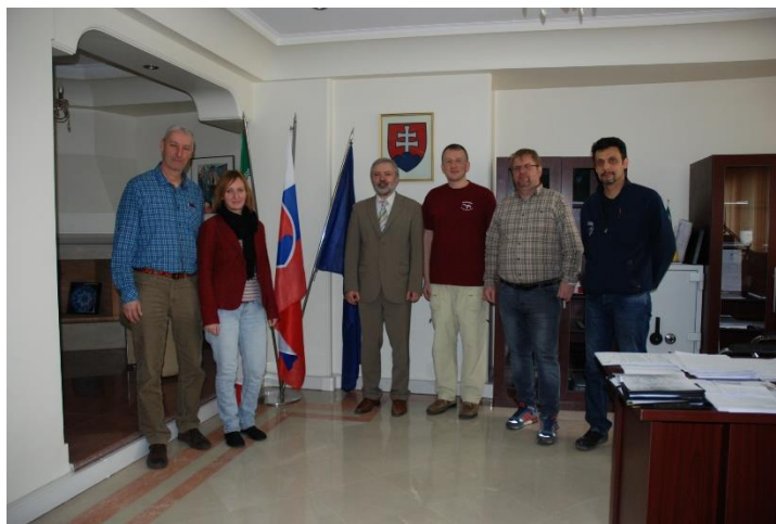
Prijatie u veľvyslanca SR v Iráne

Na obed sme mali možnosť prezrieť si najväčšiu doterajšiu zbierku skamenelín stavovcov v Iráne a oboznámiť sa s nálezovými okolnosťami. V podvečer nastupujeme do autobusu smer Zanjaň, kde prichádzame po 4 hodinách jazdy diaľnicou vedúcej z metropoly Iránu smerom do Turecka.