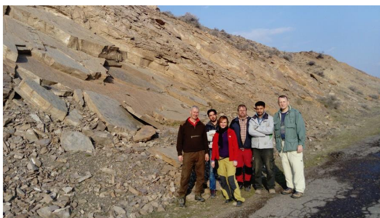
Prieskum v západnej časti pohoria Alborz

Našu eufóriu umocňuje pozvanie na tradičnú iránsku večeru v neďalekej dedinke. Do Zanjana sa vraciame neskoro v noci – naplnený spokojnosťou z dnešného úlovku.