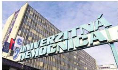
Košičania sa dočkajú, nemocnica dostane novú tvár.

V areáli Rastislava navrhne koncepcia rekonštrukciu monobloku XIX, výstavbu objektu Centra pre duševné zdravie a objektu infektológie a pneumológie a následný presun lôžkových oddelení nachádzajúcich sa vo východnej časti areálu, ktoré fungujú vo