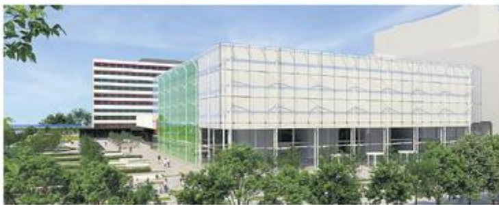
Vizualizácia novej podoby nemocnice.

Na končiaroch je stále veľa snehu. Vo štvrtok ráno namerali na Lomnickom štíte 254 a na Chopku 179 cm. Štrbské Pleso má tiež ešte 11 cm. „V roku 2005 malo snehová pokrývku až do 3. mája. Ak to teraz do tohto dátumu nevydrží, aj tak tam pôjde o druhé najdlhšie neprerušované trvanie bielej periny. Vlni sa vytvorila 27. novembra, čiže je tam už viac ako päť mesiacov. Minulú sezónu sa napríklad udržala len 124 dní," doplnil klimatológ. © AUTORSKÉ PRÁVA VYHRADENÉ