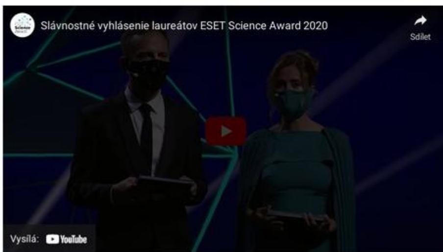
ESET Science Award 2020