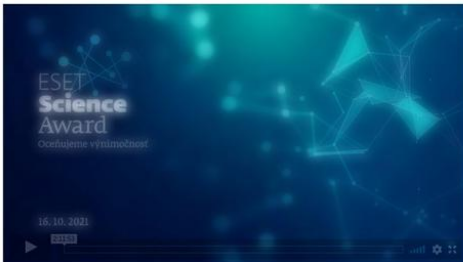
ESET Science Award 2021