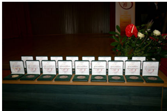
Foto: Slávnostný program spojený s odovzdaním ocenení jubilantom v Aule LF na Triede SNP 1

Slávnostné prednášky – sekcia štátnicových predmetov: