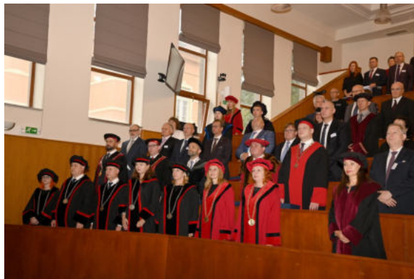
Slávnostné zasadnutie Vedeckej rady UPJŠ LF v historickej posluchárni LF na ulici Dr. Kostlivého