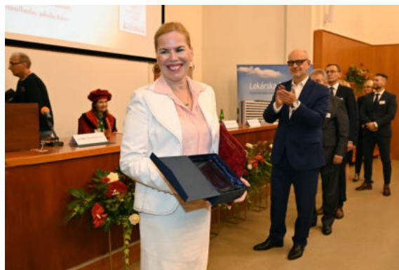
Foto: Odovzdávanie ocenení zástupcom akademických pracovísk a partnerských inštitúcií v historickej v posluchárni LF na ulici Dr. Kostlivého