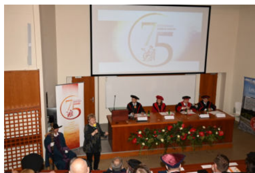
Foto: Prednášajúci v historickej v posluchárni LF na ulici Dr. Kostlivého