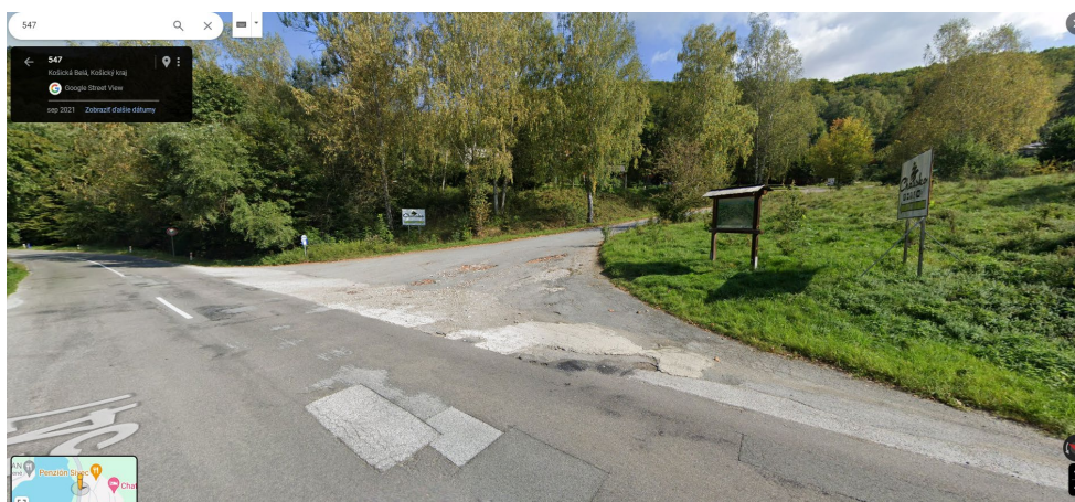
Obr. zastávky kde je potrebné vystúpiť: Košické Hámre – most (oproti vidíte priehradu Ružín)