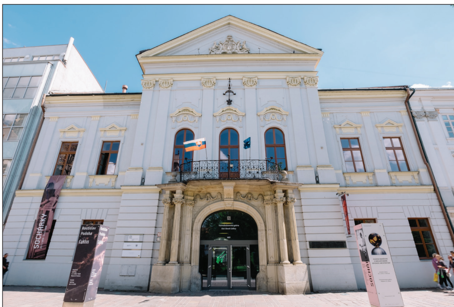
Obr. 11: Súčasnú sídlo Východoslovenskej galérie (bývalý Župný dom, resp. Dom Košického vládného programu).

Bohatá umelecká minulosť Košíc ako metropoly východnej časti Slovenska, tradícia zberateľstva umeleckohistorických pamiatok, či čulý umelecký život v prvých rokoch po vzniku prvej ČSR, boli činitele, ktoré predurčili Košice na to, aby sa stali sídlom prvej galérie s regionálnym pôsobením (resp. prvej krajskej galérie) na Slovensku. Po úspešnej výstavnej činnosti VSM v medzivojnovom období, prerušenej druhou svetovou vojnou, sa prakticky hneď po roku 1945 začali ozývať hlasy po založení galérie nielen zo strany umelcov organizovaných vo výtvarnom odbore Východoslovenského kultúrneho spolku Svojina, ale aj verejnosti. Závažným faktorom bol predovšetkým hodnotný zbierkový fond vtedajšieho Št. VSM, z ktorého boli vyčlenené zbierky pre krajskú galériu. Najmä vďaka tomu mohla oficiálne začať svoju činnosť už o dva mesiace po založení. Podporu našla aj v SNG v Bratislave, ktorá krajskej galérii neraz pomohla prekonať počiatkové ťažkosti rôzneho druhu. Bohatá tradícia galerijnej práce v Košiciach, ktorá siaha do poslednej štvrtiny 19. storočia a naplno sa rozvinula v prvej polovici 20. storočia tak determinovala vznik tejto najstaršej galérie regionálneho charakteru na našom území.