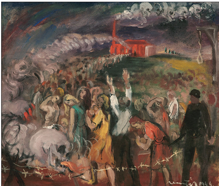
Obr. 4: Július Nemčík: Osvienčim, 1944.