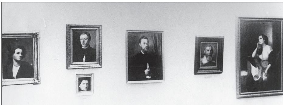
Obr. 7: Pohľad do prvej výstavy Krajskej galérie v Košiciach, 1952.