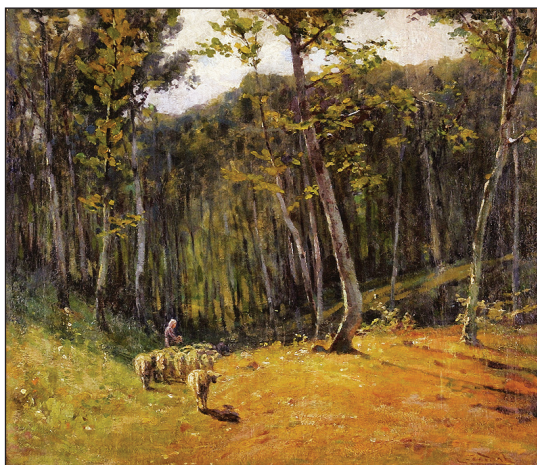
Obr. 10: Ľudovít Csordák: Les s ovcami, 1900 – 1910.