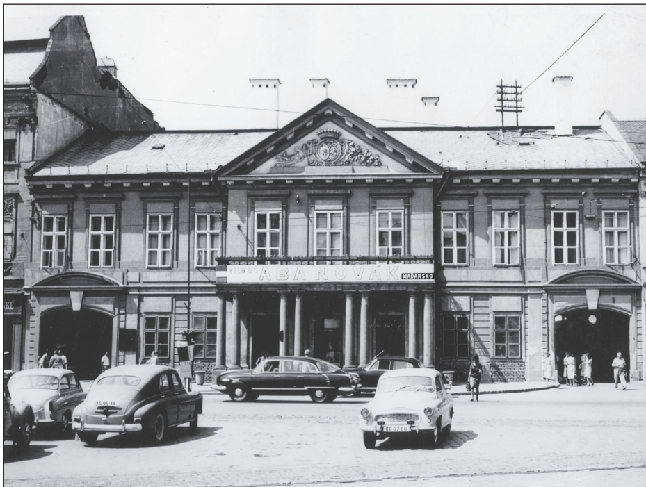
Obr. 8: Sídlo Krajskej galérie v Košiciach od roku 1953 (bývalý Dessewffyho palác), 60. roky (Zdroj: Dokumentačné centrum Východoslovenskej galérie v Košiciach).

mi prevádzkovými i depozitárnymi miestnosťami. 56 JNV v Košiciach vyhovel žiadosti krajskej galérie o pridelenie miestností, kde dovtedy sídlil národný podnik Hukostav, už 26. júna 1952. 57 Na základe porady konanej dňa 5. januára 1953 na VIII. ref. KNV bol galérii v rámci akcií pamiatkovej údržby oficiálne pridelený objekt bývalého Dessewffyho paláca na vtedajšej Leninovej ul. č. 78, kde sa malo v I. štvrtroku 1953 pokračovať na adaptačných prácach I. etapy započatých v IV. štvrtroku 1952 na základe dodaných projektov Stavoprojektu Košice. Predbežná kvóta pre I. štvrtrok bola určená na 1 milión Kčs. 58 Po realizácii provizórnych adaptačných prác na poschodí predného traktu budovy došlo k nastahovaniu do budovy v polovici januára 1953. 59 Samotná galéria bola v nových priestoroch sprístupnená 25. januára 1953. 60