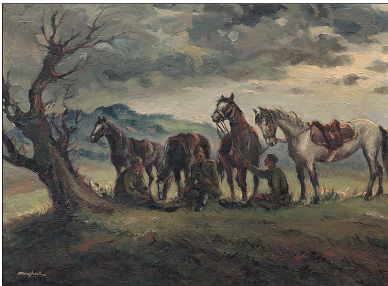
Obr. 5: Jozef Majkut: Jazdecká hliadka na odpočinku, 1949 – 1953 (Zdroj: Zbierkový fond Východoslovenskej galérie v Košiciach).