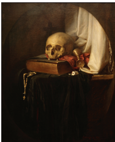
Obr. 9: Gyula Benczúr: Zátišie s lebkou a knihou, 1860.

Samotná krajská galéria čelila spočiatku mnohým problémom. Tým hlavným bolo to, že nebola zaradená do finančného rozpočtu KNV a teda nemala vlastné prostriedky na fungovanie, čo však bolo v priebehu roka 1952 doriešené a galéria mohla rozvinúť svoju výstavnú činnosť. V roku 1952 sa jej podarilo zaobstarať potrebných pracovníkov; nadviazať styky so SNG, múzeami a slovenskou sekciou Zväzu československých výtvarných umelcov; vykonať hrubé roztriedenie a výber výtvarných diel zo zbierok Št. VSM; realizovať nákup diel zo súkromných zbierok (v hodnote 311 000 Kčs) schválených nákupnou komisiou; vykonať výber, súpis a katalogizovanie obrazov sústredených zo zrušeného kláštora v Jasove; zozbierať, ošetriť, pripraviť materiál a uskutočniť výstavy „Východoslovenskí maliari XIX. storočia“, „Kresby Ľudovíta Čordáka a Jozefa Hanulu“, „III. krajská výstava obrazov a plastík“. V roku 1952 bolo do zbierky krajskej galérie zapísaných celkovo 204 umeleckých diel, z toho 38 darov a 166 depozitov. Pre príručnú knižnicu bolo zakúpených 80 titulov o výtvarnom umení. Výstavy navštívilo 5 653 platiacich osôb, 596 osôb s voľným vstupným a 6 938 osôb v skupinových návštevách. Celkovo teda 13 187 osôb. 62