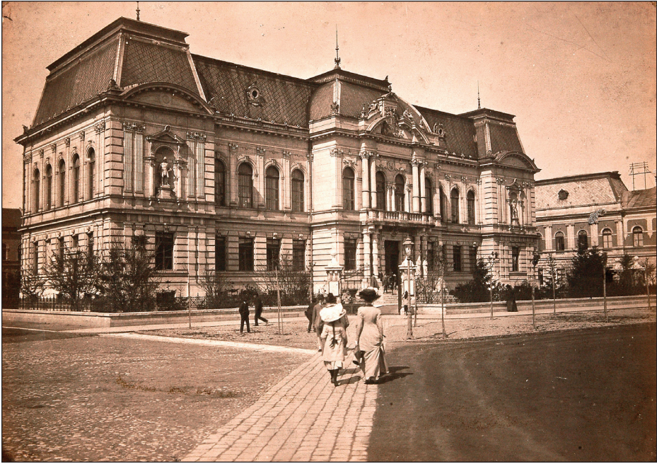
Obr. 1: Východoslovenské múzeum, nedatované.