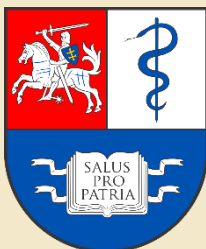
University of Health Sciences Litva