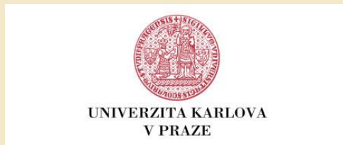
Univerzita Karlova v Prahe Česká republika