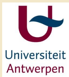
University of Antwerp Belgicko