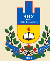
Chernivtsi National University Ukrajina