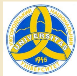
Uzhorod National University Ukrajina