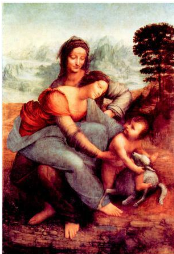
Leonardo da Vinci: Sv. Anna, Mária a malý Ježiš