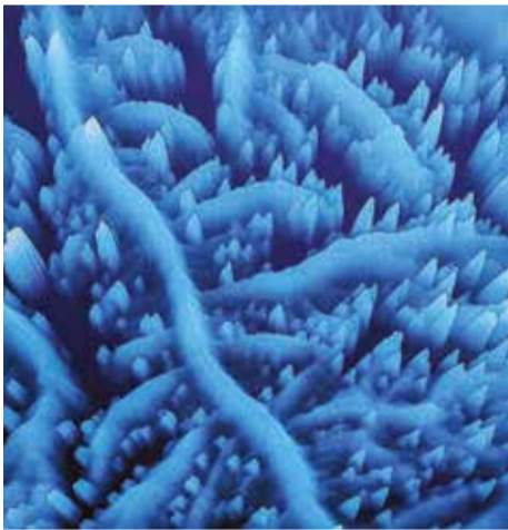
Slzná tekutina pacienta s diabetes mellitus II. typu, liečeného antidiabetikami (101).