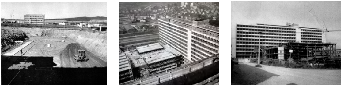
(Historické snímky z výstavby budovy teoretických ústavov a auly LF)

Vznik Lekárskej fakulty v Košiciach je spätý s rozvojom zdravotníctva v povojnovom období - bol to najdôležitejší krok k postupnému riešeniu veľmi zložitých zdravotníckych pomerov na východnom Slovensku, kde chýbali nielen zdravotnícke zariadenia, ale aj odborní zdravotnícki pracovníci, predovšetkým lekári.