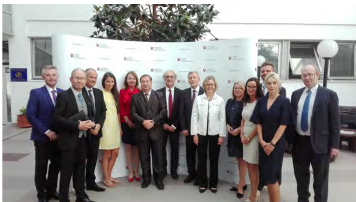
(Foto z úvodného stretnutia SLOVACRIN 11.9.2018 na MZ SR v Bratislave)

Na pôde Ministerstva zdravotníctva SR sa 11. septembra 2018 uskutočnilo stretnutie na najvyššej úrovni, na ktorom sa Slovenská republika stala súčasťou medzinárodnej paneurópskej organizácie zameranej na všetky formy klinického výskumu - ECRIN (European Clinical Research Infrastructure Network). Položili sa tak základy pre SLOVACRIN (Slovak Clinical Research Infrastructure Network), pričom Slovenská republika získala štatút pozorovateľa.