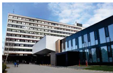
Lekárska fakulta UPJŠ v Košiciach

Má už 75-ročnú históriu - od svojho založenia v septembri 1948 pripravila na svoje budúce povolanie už vyše 16-tisíc úspešných absolventov. Na UPJŠ LF aktuálne študuje v dennej forme vyše tritisíc študentov v I. a II. stupni vysokoškolského štúdia, vrátane zahraničných študentov z vyše 50 krajín sveta. UPJŠ LF realizuje aj postgraduálne vzdelávanie - doktorandské štúdium a ďalšie vzdelávanie zdravotníckych pracovníkov. Popri pedagogickej činnosti vyvíja fakulta bohaté vedecko-výskumné aktivity v rámci rôznych národných a medzinárodných projektov.