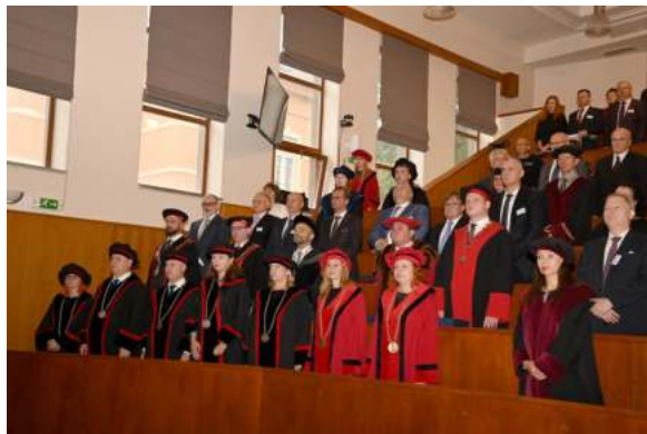
Foto: Slávnostné zasadnutie Vedeckej rady UPJŠ LF v historickej posluchárni LF na ulici Dr. Kostlivého