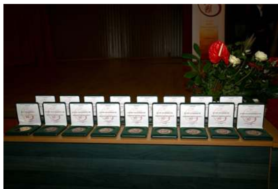
Foto: Slávnostný program spojený s odovzdaním ocenení jubilantom v Aule LF na Triede SNP 1

Slávnostné prednášky – sekcia štátnicových predmetov: