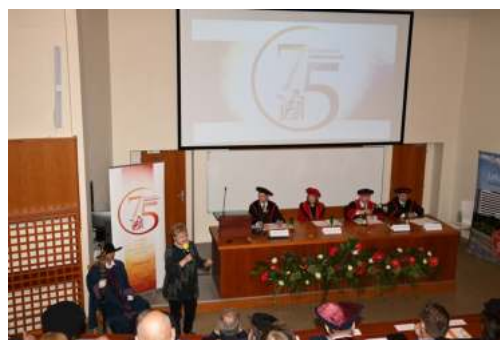
Foto: Prednášajúci v historickej v posluchárni LF na ulici Dr. Kostlivého