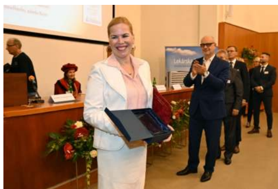
Foto: Odovzdávanie ocenení zástupcom akademických pracovísk a partnerských inštitúcií v historickej posluchárni LF na ulici Dr. Kostlivého