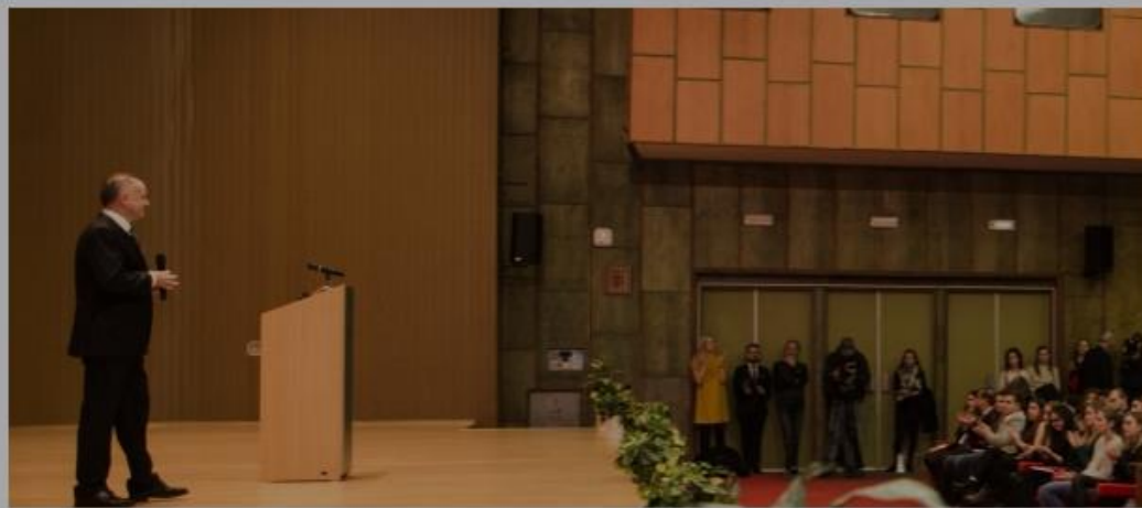
Prezident SR Andrej Kiska sa stretol so študentmi UPJŠ v Košiciach