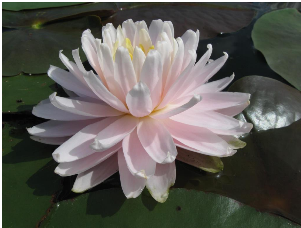
Nymphaea 'Gloire d' Temple Sur Lot'