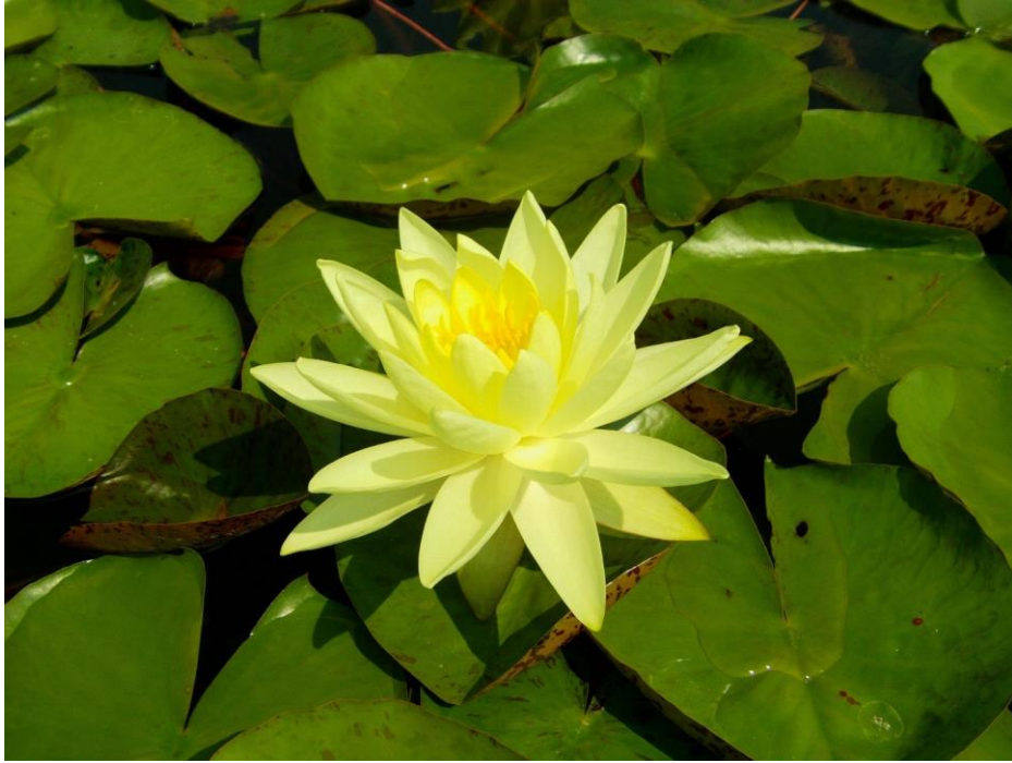
Nymphaea 'Gold Medal'