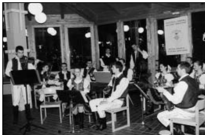
Folklorný súbor Zemplín počas vystúpenia osláv Dní Košíc na Univerzite v Bayreuthe

Univerzita v Bayreuthe výrazne prispela k zriadeniu Fakulty verejnej správy UPJŠ, ako štvrtej fakulty Univerzity Pavla Jozefa Šafárika. V roku 1990 došlo z podnetu nemeckej strany k nadviazaniu kontaktov medzi Univerzitou v Bayreuthe a UPJŠ. V priebehu krátko obdobia bola podpísaná zmluva o vzájomnej spolupráci medzi obidvoma vysokoškolskými inštitúciami. Jedným z prvých konkrétnych výsledkov spolupráce bol návrh Univerzity v Bayreuthe vytvoriť na UPJŠ Inštitút pre verejnú správu, ako vysokoškolskú inštitúciu, ktorá by v rámci magisterského štúdia pripravovala absolventov pre oblasť verejnej správy. Nemecká strana zdôrazňovala potrebu takejto vysokoškolskej ustanovizne skúsenosťami z vlastnej krajiny, ako aj skúsenosťami z iných krajín demokratického sveta. Zvýrazňovala význam a poslanie verejnej správy ako dôležitého predpokladu rozvoja právneho, demokratického i sociálneho štátu, a v tejto súvislosti poukázala na nutnosť špecifickej prípravy budúcich pracovníkov (manažérov) v oblasti štátnej správy a samosprávy.