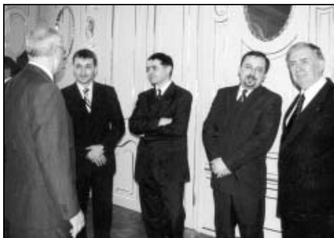
Prijatie vedcov UPJŠ u prezidenta Slovenskej republiky