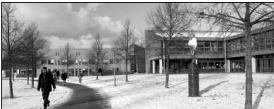
Univerzita v Bayreuthe

Univerzita v Bayreuthe je jednou z najmladších univerzít v Nemecku a poskytuje štúdium pre približne 8 000 študentov na svojich 6 fakultách. Študenti si môžu zvoliť štúdium na Fakulte matematiky a fyziky, na Fakulte biológie, chémie a geológie, na Fakulte práva a ekonomiky, na Fakulte lingvistiky a literárnych vied, na Fakulte kultúrnych vied a na Fakulte aplikovaných prírodných vied. S Univerzitou v Bayreuthe má naša univerzita už dlhoročnú spoluprácu v oblasti vedy a výskumu, ide najmä o spoluprácu v rámci projektov DAAD, ako aj v rámci programu Európskeho spoločenstva v oblasti vzdelávania - Socrates/Erasmus.