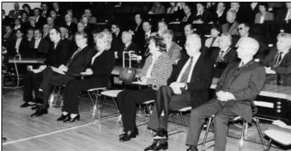
Pohľad na hostí počas slávnostného príhovoru rektora univerzity v Bayreuthe